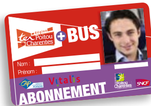
Carte TER+bus Poitiers