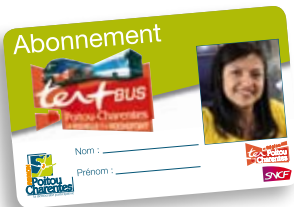
Carte TER+bus La Rochelle - Rochefort